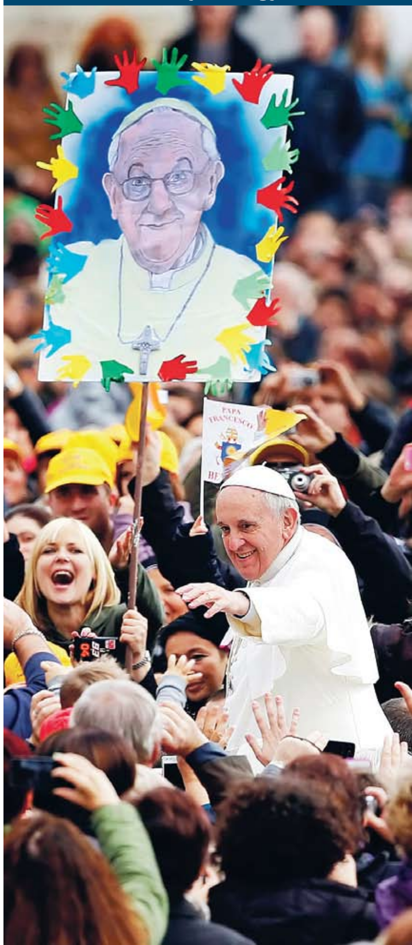
Ferenc pápa a római Szent Péter téren. A La Repubblica értesülései szerint 2014-ben rendezhetik meg azt a történelmi csúcsot, amelyen a katolikus egyházfő és az orosz pravoszlávok feje, Kirill pátriárka találkozik egymással. Helyszíntként az itália Bari, illetve Bécs mellett a „semleges területnek” számító Pannonhalma is szóba jöhet. →7

Pannonhalma is esélyes az egyházi csúcsra