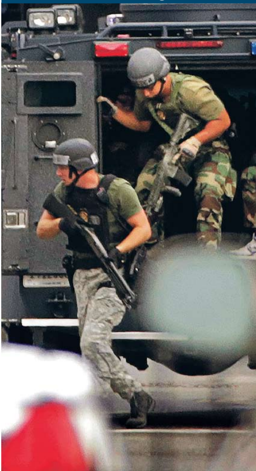
A támadóval együtt tizenkét halálos áldozata van az amerikai haditengerészet washingtoni bázisán kitört lövöldözésnek. Feltételezett társát lapzártánk idején is óriási erővel keresték. →3