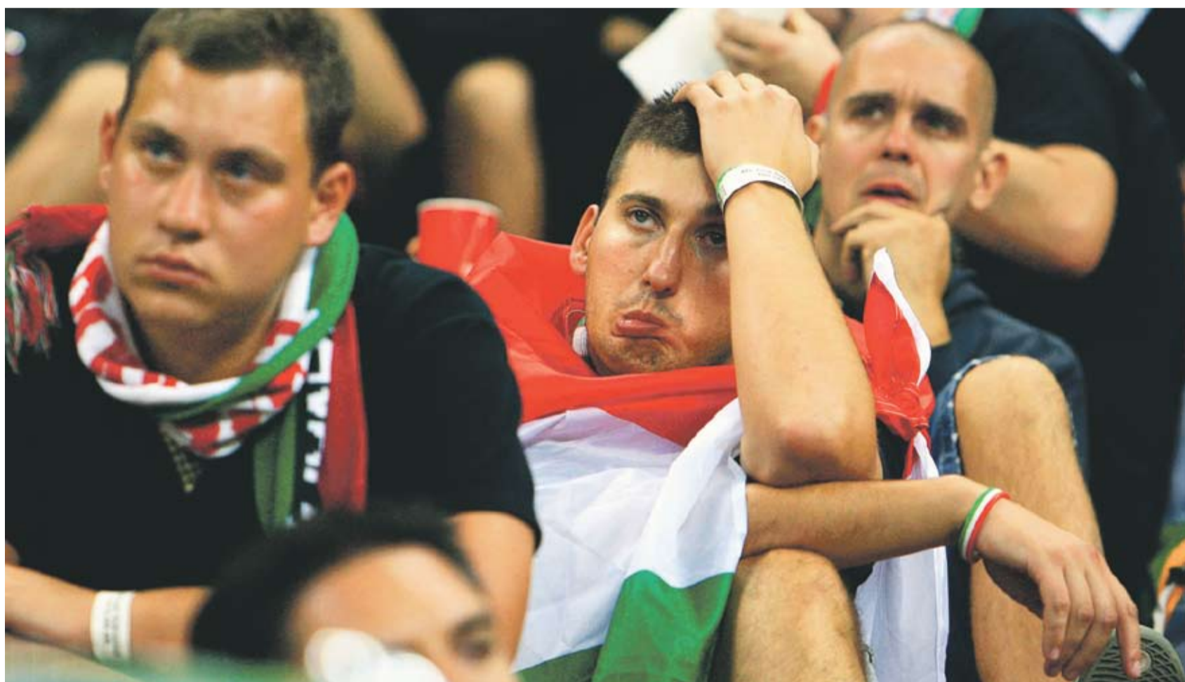
Jobbra számítottak. Magyar szurkolók a Nemzeti Aréna tribünjén

A magyar labdarúgó-válogatottnak nem volt esélye nemhogy a győzelemre, de a tisztas helytállásra sem Bukarestben. A második percben egy gyermek hiba után Románia vezetést szerzett, és többé vissza sem nézett: végül 3-0-ra nyertek a házigazdák. A korábban sokak által esélyesnek álmódott, ám a pályán feltűnően gyámoltalan magyarok végig alárendelt szerepet játszottak, a támadók nem tudtak igazi gólveszélyt teremteni, míg a kapus Bogdán Ádám több ziccet is há-