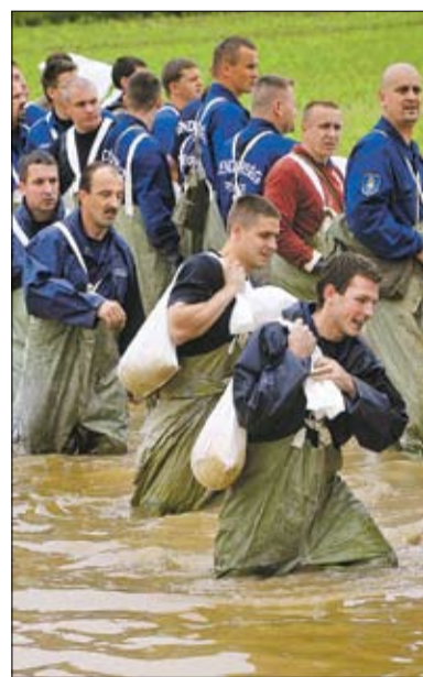
Szendrőn szolgálnak és védenek